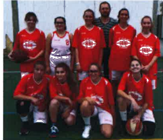
Les U 15 féminines