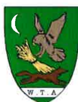
Willingham-by-Stow ROYAUME UNI